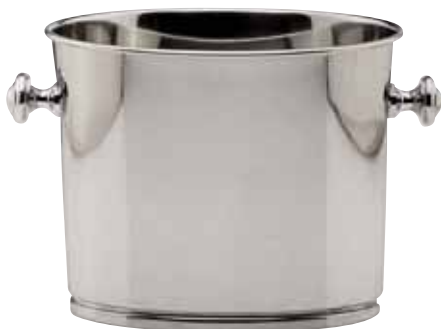
Weinkühler, Wine cooler, Seau à vin oval, für 2 Flaschen, oval, for 2 bottles, ovale, pour 2 bouteilles