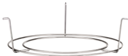
Ring für Gläser, Ring for glasses, Anneau pour verres