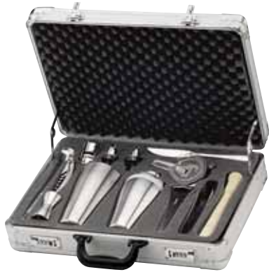
Barkoffer, Bar set, Garniture à bar komplett, complete, complète