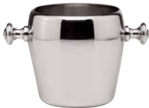
Roheisbehälter, Ice bucket, Seau à glace