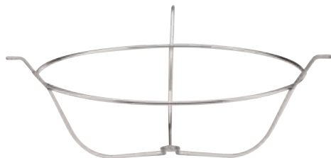
Ring für Glaseinsatz, Insert, Ring pour insert en verre