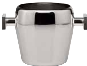
Roheisbehälter, Ice bucket, Seau à glace