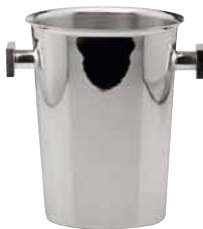
Weinkühler, Wine cooler, Seau à vin für 1 Flasche, for 1 bottle, pour 1 bouteille