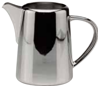
Eiswasserkanne, Water pitcher, Carafe à eau glacée