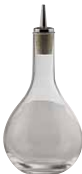
Bitterflasche, Bitter bottle, Flacon à Angostura