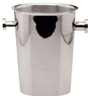
Weinkühler, Wine cooler, Seau à vin für 1 Flasche, for 1 bottle, pour 1 bouteille