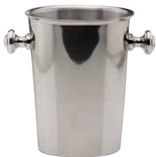
Weinkühler, Wine cooler, Seau à vin für 1 Flasche, for 1 bottle, pour 1 bouteille