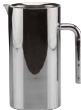
Eiswasserkanne, Ice water pitcher, Carafe à eau glacée doppelwandig, double walled, double paroi