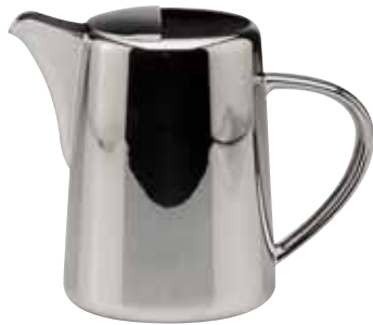
Eiswasserkanne, Water pitcher, Carafe à eau glacée mit Eislippe, with ice-lip, avec lip glacés