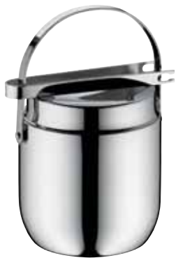
Roheisbehälter, Ice bucket, Seau à glace mit Roheiszange, with ice tongs, avec pince à glace