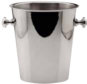
Weinkühler, Wine cooler, Seau à vin für 2 Flaschen, for 2 bottles, pour 2 bouteilles