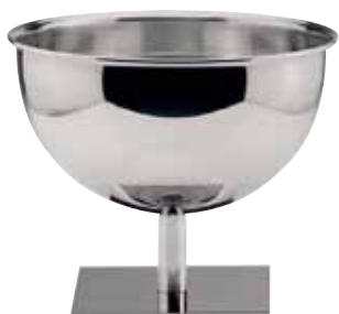
Champagnerschüssel, Champagne bowl, Seau à champagne ohne Einsatzring, without ring for glass insert, sans anneau