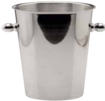
Weinkühler, Wine cooler, Seau à vin für 2 Flaschen, for 2 bottles, pour 2 bouteilles