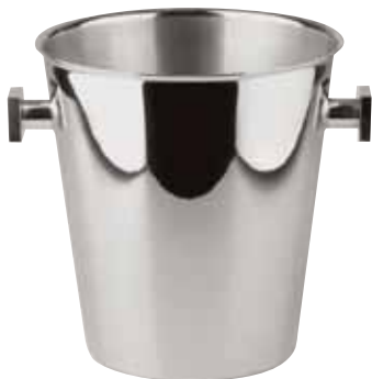
Weinkühler, Wine cooler, Seau à vin für 2 Flaschen, for 2 bottles, pour 2 bouteilles