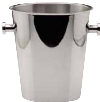
Weinkühler, Wine cooler, Seau à vin für 2 Flaschen, for 2 bottles, pour 2 bouteilles