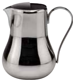
Eiswasserkanne, Water pitcher, Carafe à eau glacée mit Eislippe, with ice-lip, avec lip glacés