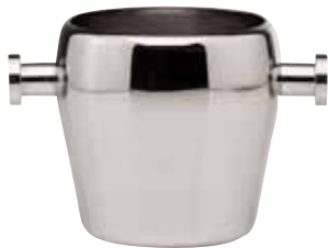
Roheisbehälter, Ice bucket, Seau à glace