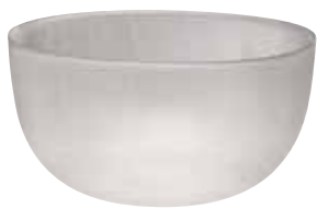
Glaseinsatz, Glass insert, Insert en verre für Eisfrucht, for iced fruit, pour fruits glacés