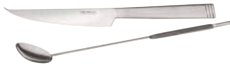
Barmesser, Bar knife, Couteau à bar