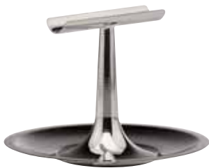
Zigarrenständer, Cigar stand, Porte-cigares