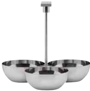
Barständer, Snack stand, Support à snack 3-tlg., 3-part, 3 parties