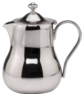
Kaffeekanne, Coffee pot, Cafetière