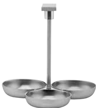
Ständer für Konfitürengläser, Stand for jam glasses, Pour verres à confiture 3-tlg., 3-part, 3 parties