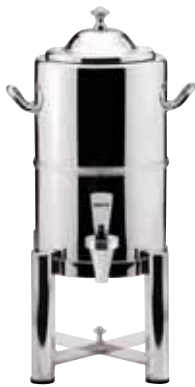
Coffee Urn isoliert, insulated