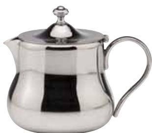
Teekanne, Tea pot, Théière