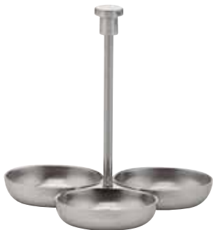
Ständer für Konfitürengläser, Stand for jam glasses, Pour verres à confiture 3-tlg., 3-part, 3 parties