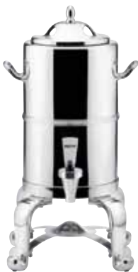
Coffee Urn isoliert, insulated