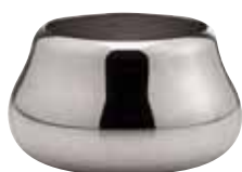
Zuckerdose, Sugar bowl, Sucrier