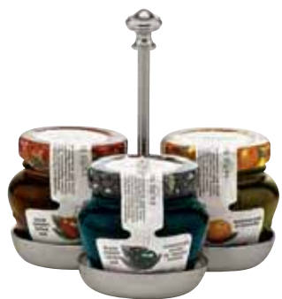
Ständer für Konfitürengläser, Stand for jam glasses, Pour verres à confiture 3-tlg., 3-part, 3 parties