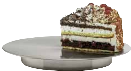
Tortenplatte, Cake plate, Plat à tarte