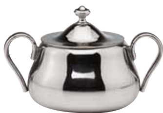
Zuckerdose, Sugar bowl, Sucrier