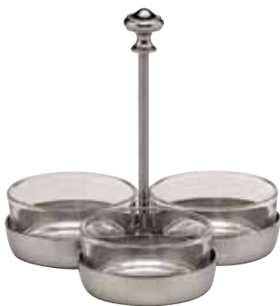
Zuckerständer, Sugar server, Service à sucre mit Glaseinsatz, with glass insert, avec insert en verre