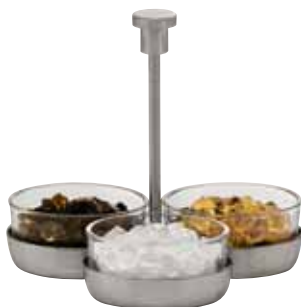
Zuckerständer, Sugar server, Service à sucre mit Glaseinsatz, with glass insert, avec insert en verre