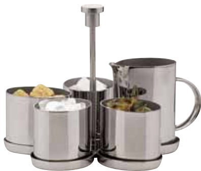
Zuckerständer, Sugar server, Service à sucre 5-tlg., für Milch und Zucker, 5-part, for milk and sugar, 5 parties, pour lait et sucre