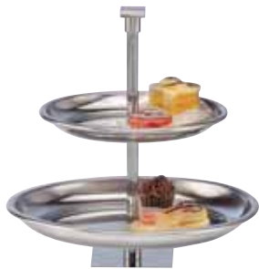
Gebäckständer, Pastry stand, Porte-petits-fours 2-tlg., 2-part, 2 parties