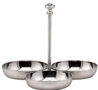
Zuckerständer, Sugar server, Service à sucre