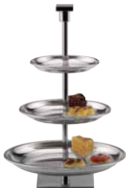
Gebäckständer, Pastry stand, Porte-petits-fours 3-tlg., 3-part, 3 parties