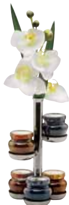
Ständer für Konfitürengläser, Stand for jam glasses, Pour verres à confiture 5-tlg., mit Vase, 5-part, with vase, 5 parties, avec vase