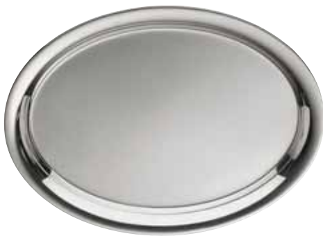
Serviertablett, Serving tray, Platteau de service oval, ovale