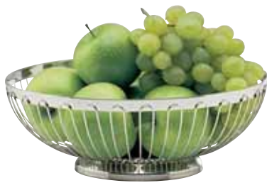
Obstkorb, Fruit basket, Corbeille à fruits